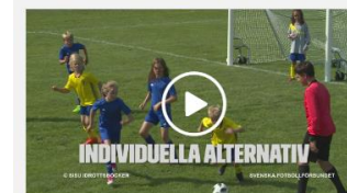
Anfallsspel 5 mot 5