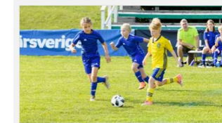
Träningspass och övningar

Med inlogg till Fotbollsportalen där SvFF Spelarutbildningsplan finns kommer ni åt en övningsbank och filmklipp Det finns färdiga träningspass, dela träningspass med fler ledare i laget inför en träning samt skapa egna övningar.