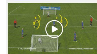
Försvarsspel 5 mot 5