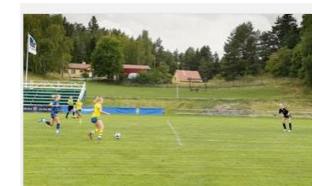
Träningspass och övningar 9 vs 9

Med inlogg till Fotbollsportalen där SvFF Spelarutbildningsplan finns kommer ni åt en övningsbank och filmklipp Det finns färdiga träningspass, dela träningspass med fler ledare i laget inför en träning samt skapa egna övningar.